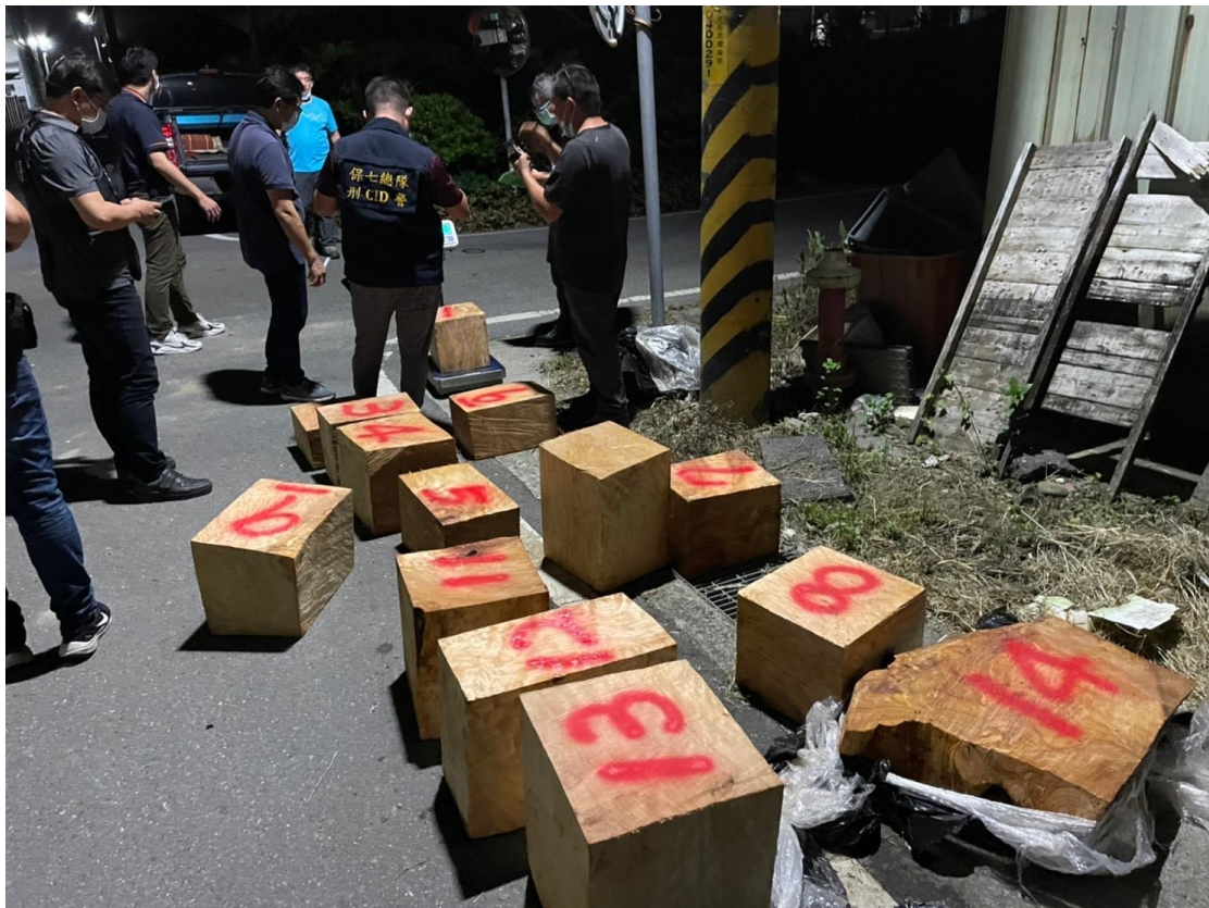
以上為北斗鎮據點查獲之扁柏