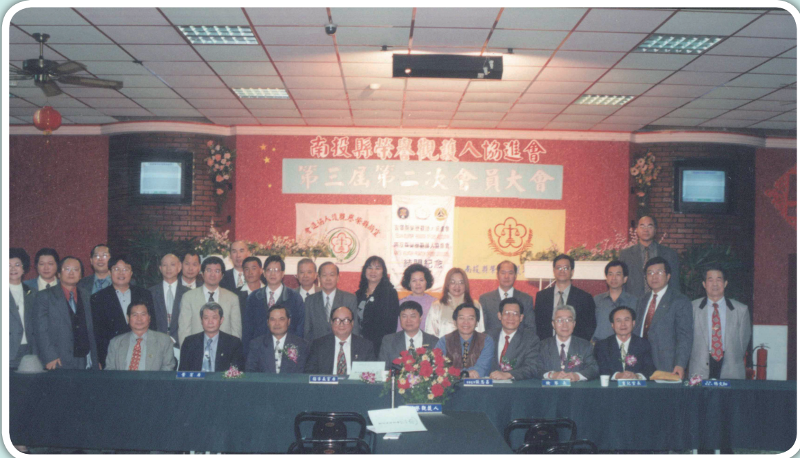
榮譽觀護人本著服務社會之精神，協助本署辦理社區處遇、執行保護管束及其他司法保護事務。